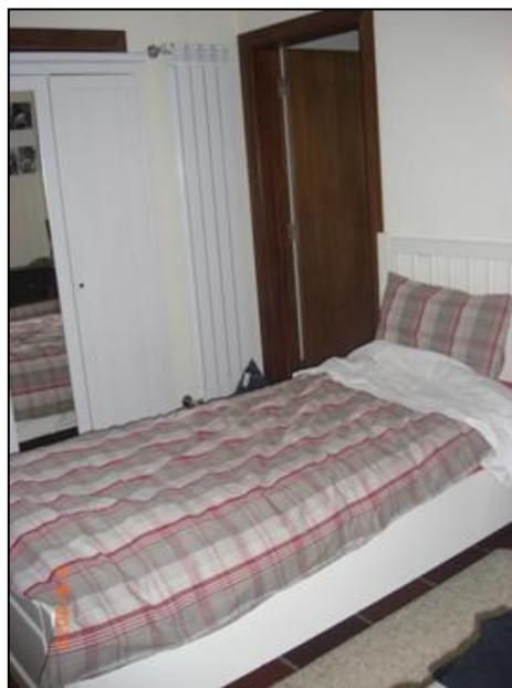
Værelset hedder Old Paris