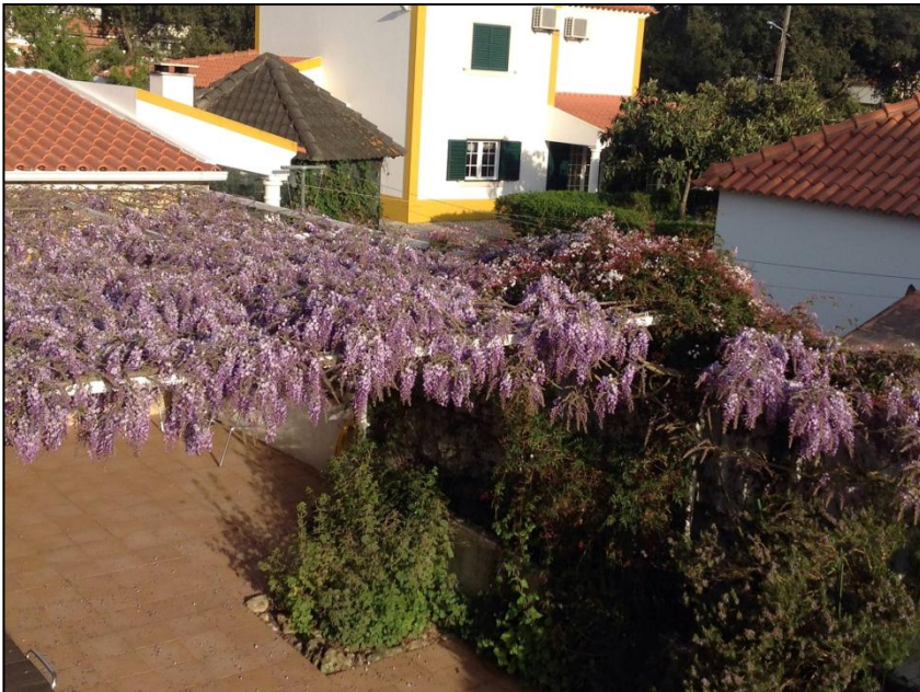
Fra balkonen, hvor der er bord og stole, så du skal slappe eller spise din frokost