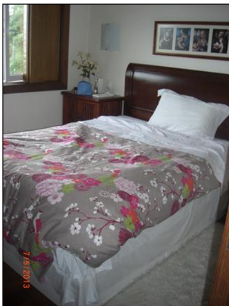
Værelset hedder Da Vinci

Fællesstuen indeholder: spisebord, sofaområde, køleskab, mikroovn, brødrister og vandkedel. Alle er velkommen til at benytte køkkenet i stueetagen. I køkkenet vasker du også de glas, tallerkner mv. op som du bruger.